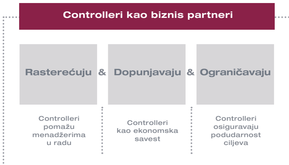
Slika 3: Controller kao podrška menadžeru po Weberu i Schäfferu

Saradnja između menadžera i controllera u ovoj vrsti poslovnog partnerstva trebalo bi da bude na ravnopravnoj osnovi. Mada menadžeri određuju smer za ostvarivanje ciljeva kompanije, controlleri snose zajedničku odgovornost. Zato controlleri ne bi trebalo da pasivno čekaju na instrukcije menadžera već da deluju kao proaktivni, komplementarni partneri menadžmenta . To važi za rutinske poslove kao i za nova fundamentalna kretanja, npr. uspostavljanje orijentacije ka ekonomskoj vrednosti ili održivosti u korporativnom upravljanju. Glavni aspekt uloge poslovnog partnera jeste da identifikuje i promoviše te teme. Sve je važnije da controlleri postignu ravnotežu između, s jedne strane, svog aktivnog učešća u procesu upravljanja i davanja ličnih ideja i, s druge strane, svoje restriktivne funkcije kao čuvara interesa kompanije i kritičkog sparing partnera („ učešće nasuprot nezavisnosti “). Controlleri moraju da budu u stanju da obavljaju obe funkcije.