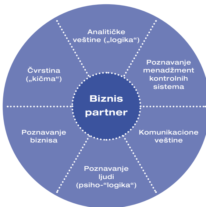
Slika 4: Ključne kompetencije controllera

Da bi controlleri pružali sveobuhvatnu podršku menadžerima, potreban im je širok spektar veština koje se mogu svesti na šest osnovnih sposobnosti. One već čine osnovu „klasičnog“ dijagrama Albrechta Deyhleja o zahtevima posla a postaju još i važnije za controllera kao poslovnog partnera: