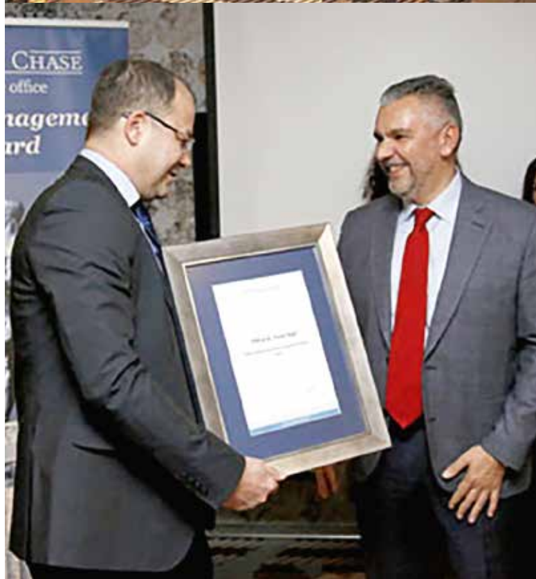
Talent management Award 2016

Posebno me raduje da smo 2016. godine dobili prvu nagradu za Upravljanje talentima u Srbiji, što nas motiviše da nastavimo da pomeramo granice i unapredimo postojeće, ali i razvijemo nove, još bolje, programe razvoja talenata.