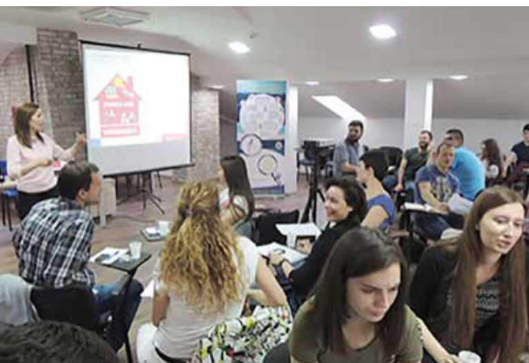
Radionica na temu upravljanja karijerom za studente Beogradskog univerziteta

U ovom svetlu, zadatak HR-a jeste da odgovori kroz najsavremenije programe i alate u motivaciji i upravljanju talentima. Takođe, trend u razvoju zaposlenih jeste korišćenje kombinovanih pristupa učenju (Blended Learning Approach), koji podrazumeva kombinaciju različitih metodologija. U praksi, zaposlenima se omogućava razvoj kroz radionice, on line obuke, in class obuke, biznis simulacije, poslovne akademije, rotacije, kao i kroz programe mentorstva i koučinga. Na ovaj način razvojne aktivnosti daju značajno bolje rezultate, a ujedno su i prilagođene stvarnim potrebama zaposlenih.